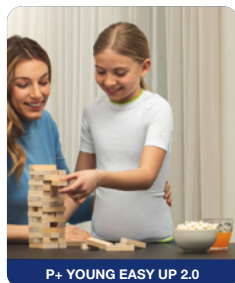
P+ YOUNG EASY UP 2.0