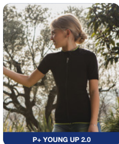
P+ YOUNG UP 2.0