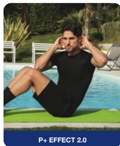
P+ EFFECT 2.0